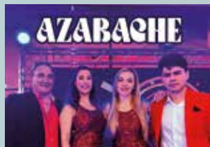
30 DE JUNIO (VIERNES) AZABACHE 23:00 H