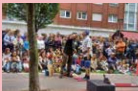
28 DE JUNIO (MIÉRCOLES) TRAPU ZAHARRA 12:30 H.