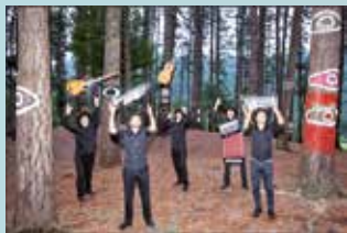
28 DE JUNIO (MIÉRCOLES) PURO RELAJO 00:00 H