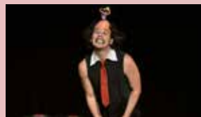
30 DE JUNIO (VIERNES) MUNDO COSTRINI 19:00 H