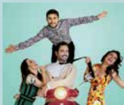
1 DE JULIO (SÁBADO) LOS SUPERSINGLES 23:00 H