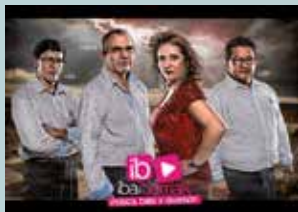
2 DE JULIO (DOMINGO) IBAIBERRIAK 23:00 H