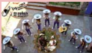
1 DE JULIO (SÁBADO) MARIACHI MEXICO LINDO 19:00 H