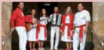
2 DE JULIO (DOMINGO) VOCES DEL EBRO 13:00 H