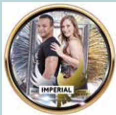
29 DE JUNIO (JUEVES) DÚO IMPERIAL 23:00 H